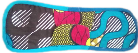
Serviette hygiénique réutilisable