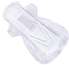
Serviette hygiénique non réutilisable

IL existe une gamme varié de protections féminines mais il n'y a pas de bonnes ou de mauvaises protections.